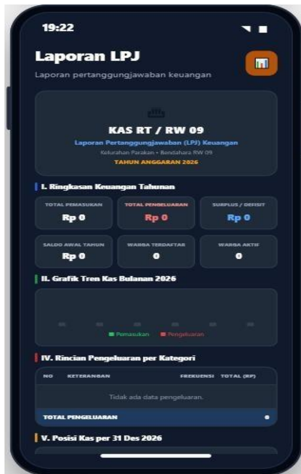
Gambar 6. Laporan Pertanggungjawaban (LPJ)

Hasil implementasi menunjukkan bahwa sistem mampu mengintegrasikan pengelolaan data warga dan transaksi keuangan ke dalam satu platform yang saling terhubung. Data pembayaran, tagihan, tunggakan, pemasukan, dan pengeluaran dapat dikelola secara terpusat sehingga mendukung proses administrasi dan pelaporan yang lebih terstruktur. Kondisi tersebut sejalan dengan pendapat Kadir (2014) yang menyatakan bahwa sistem informasi yang terintegrasi mampu meningkatkan kualitas informasi melalui penyajian data yang lebih akurat dan mudah diakses. (Kadir, 2014).