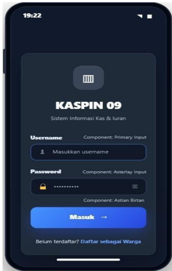
Gambar 3. Halaman Login Sistem

Akses ke dalam sistem dilakukan melalui mekanisme autentikasi pengguna yang ditunjukkan pada Gambar 3. Halaman login berfungsi untuk memverifikasi identitas pengguna sebelum memperoleh akses ke fitur yang tersedia. Penerapan autentikasi menjadi salah satu bentuk pengendalian akses untuk menjaga keamanan data administrasi dan keuangan yang tersimpan dalam sistem. Melalui mekanisme tersebut, setiap pengguna hanya dapat mengakses fungsi sesuai dengan hak akses yang dimiliki.