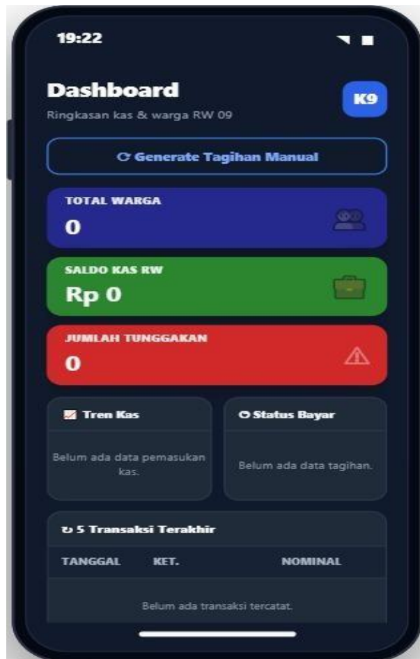
Gambar 4. Dashboard Sistem

Pengelolaan data warga dilakukan melalui fitur yang ditunjukkan pada Gambar 5. Fitur ini digunakan untuk menyimpan dan mengelola data warga yang menjadi dasar dalam proses administrasi lingkungan dan pengelolaan iuran. Administrator dapat melakukan pencarian, penambahan, serta pembaruan data warga sesuai kebutuhan operasional. Penyimpanan data secara terpusat dalam basis data membantu meningkatkan akurasi informasi serta mempermudah proses pencarian data dibandingkan penggunaan dokumen fisik yang sebelumnya digunakan dalam pengelolaan administrasi.