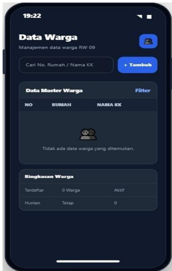
Gambar 5. Halaman Data Warga

Sistem juga menyediakan fasilitas pelaporan keuangan yang terintegrasi dengan seluruh data transaksi yang tersimpan dalam basis data. Salah satu bentuk implementasinya ditunjukkan pada Gambar 6 yang menampilkan Laporan Pertanggungjawaban (LPJ) keuangan. Informasi yang disajikan meliputi ringkasan pemasukan dan pengeluaran, saldo kas, jumlah warga terdaftar, grafik tren kas, rincian pengeluaran berdasarkan kategori, serta posisi kas pada akhir periode pelaporan. Penyajian laporan secara otomatis membantu mempercepat proses penyusunan laporan keuangan dan mengurangi potensi kesalahan yang sering terjadi pada proses rekapitulasi manual.